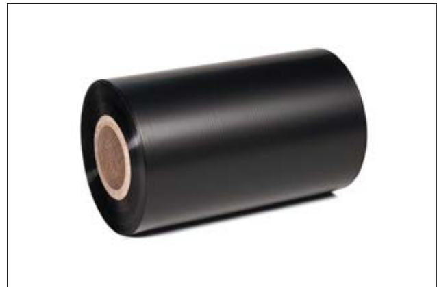
Farvebånd til udskrift af labels.